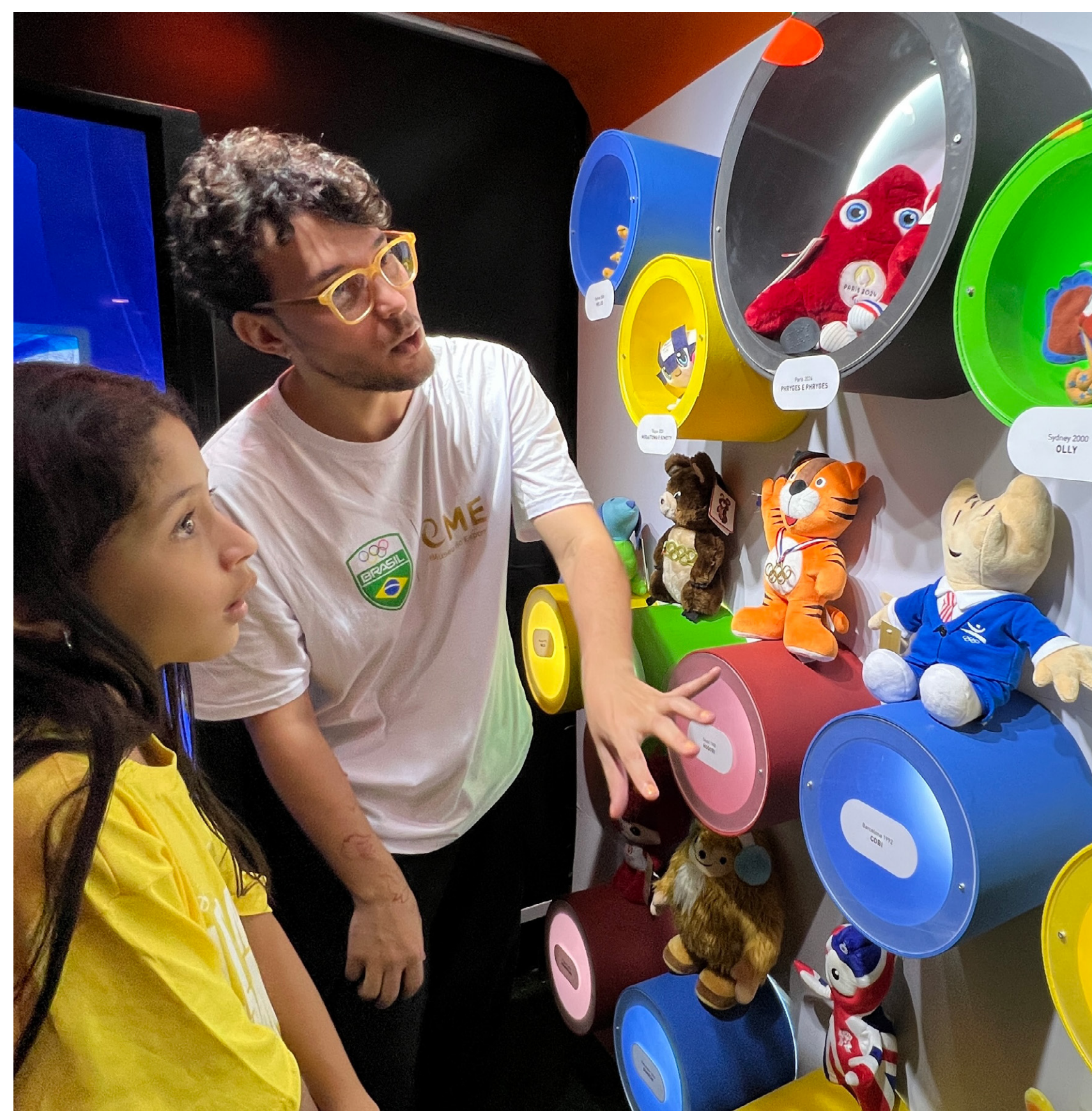
ESTANTE DOS MASCOTES