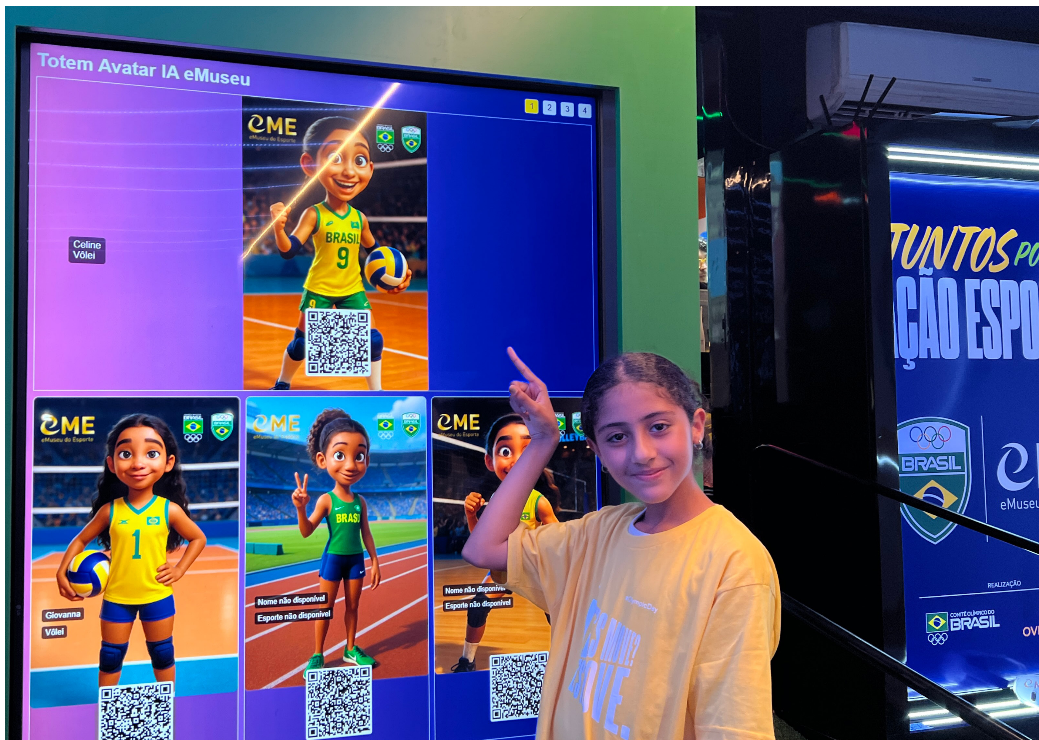
CRIAÇÃO DE AVATAR COM IA