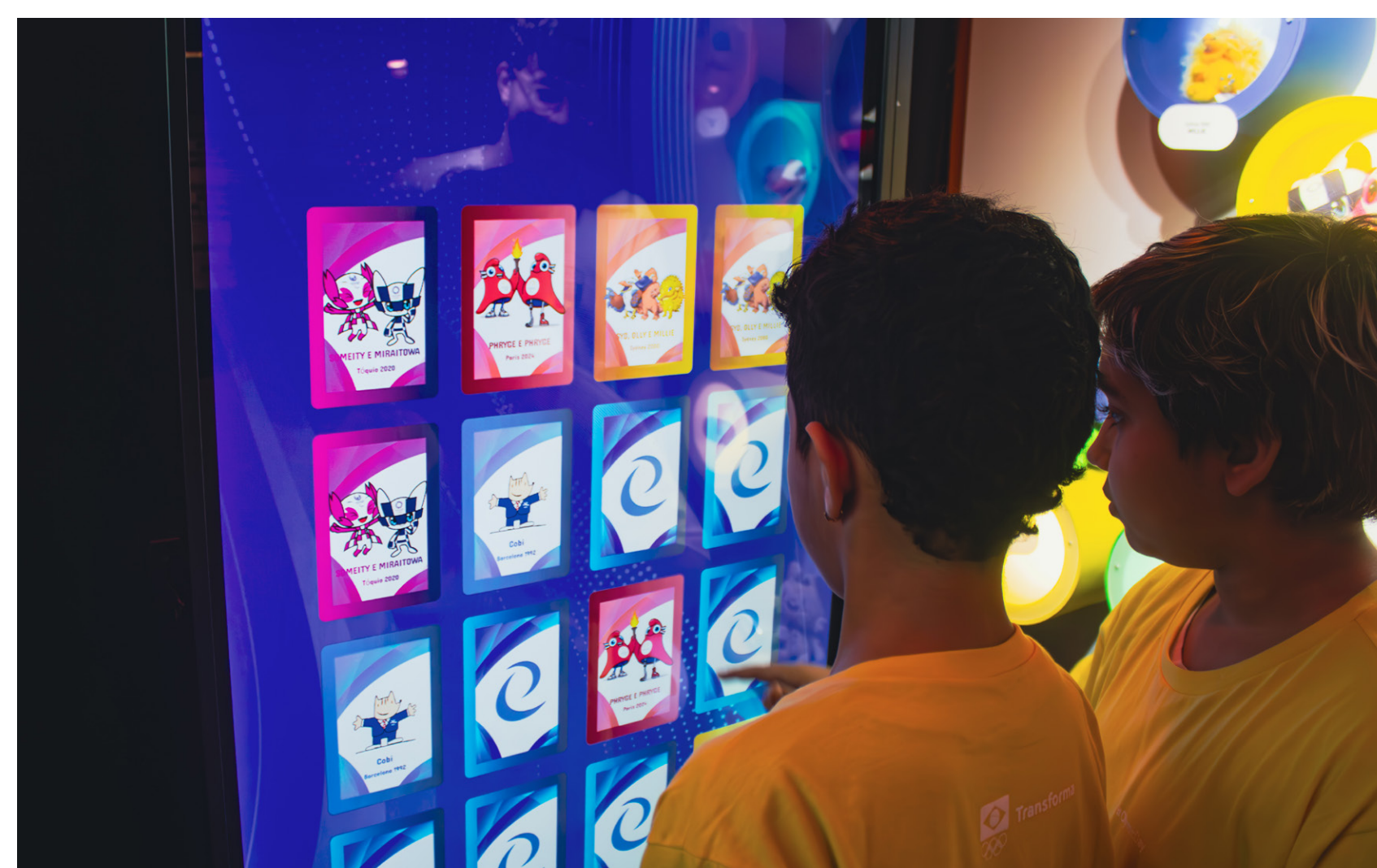
TOTEM DO JOGO DA MEMÓRIA