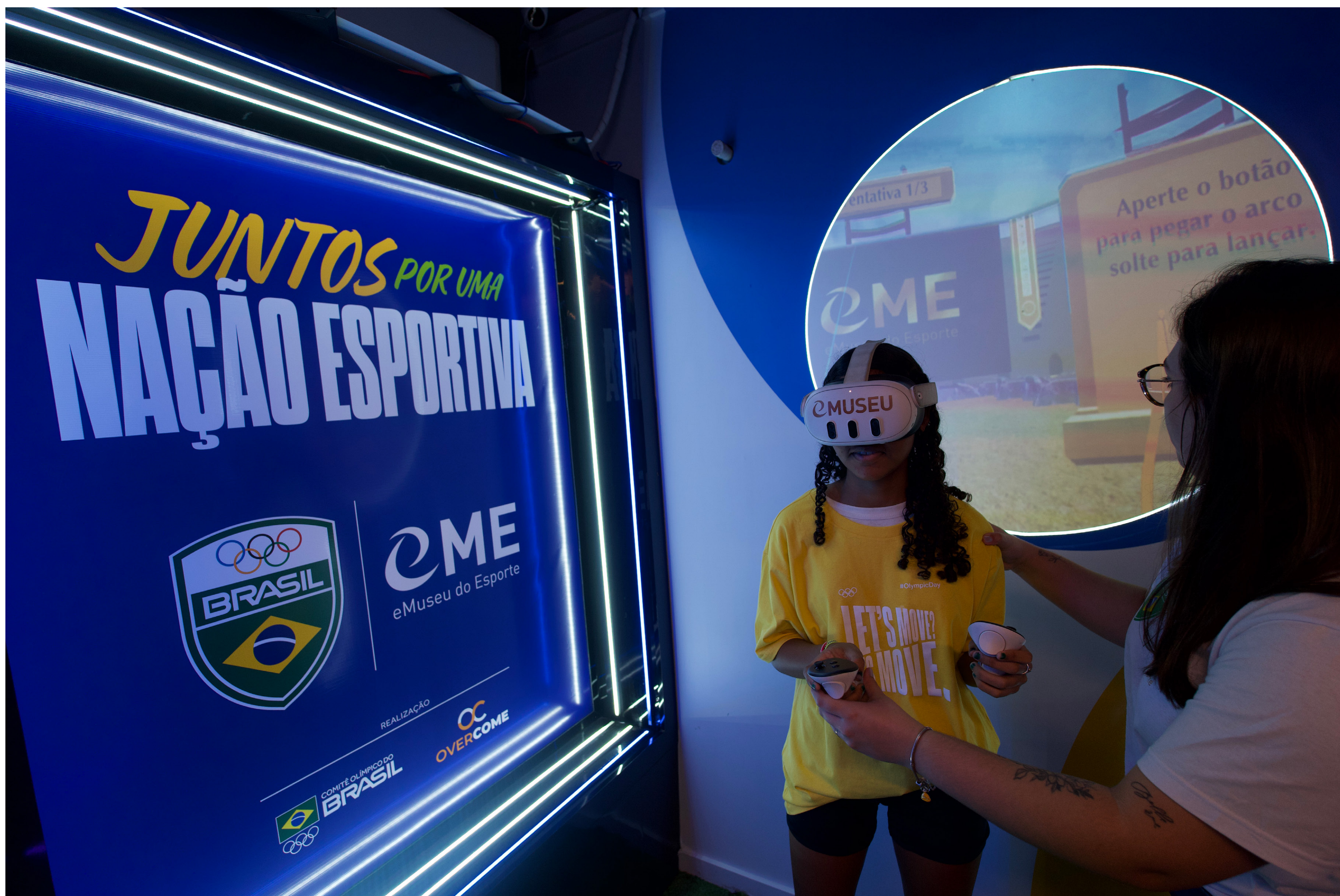
TIRO COM ARCO