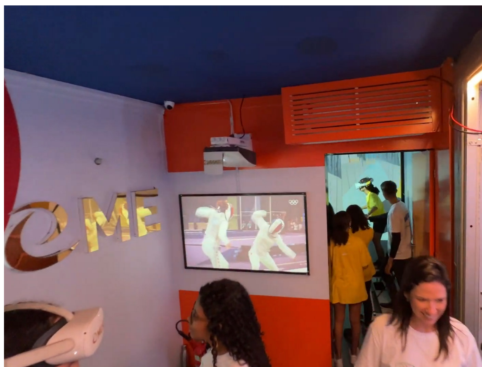
VÍDEO INSTITUCIONAL DO COB NA TELA TOUCH