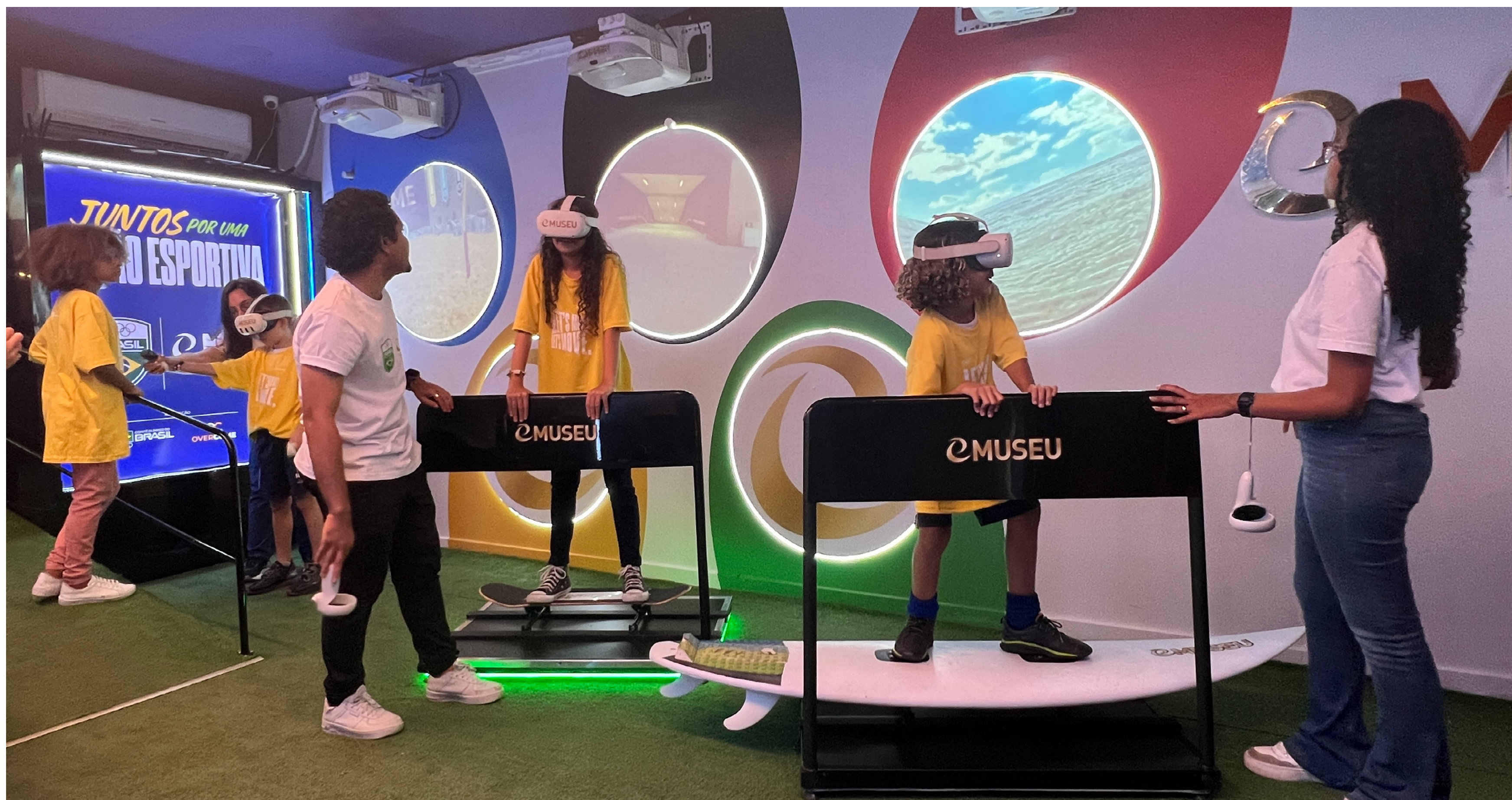
SIMULADORES DE SKATE E SURF